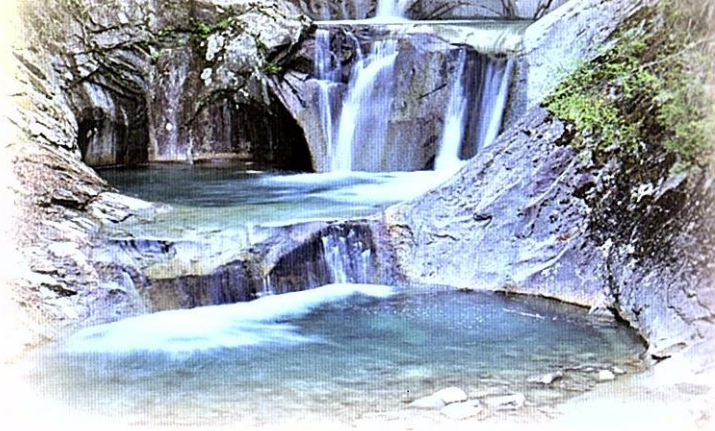
山梨県の名水の秘密は「伏流水」